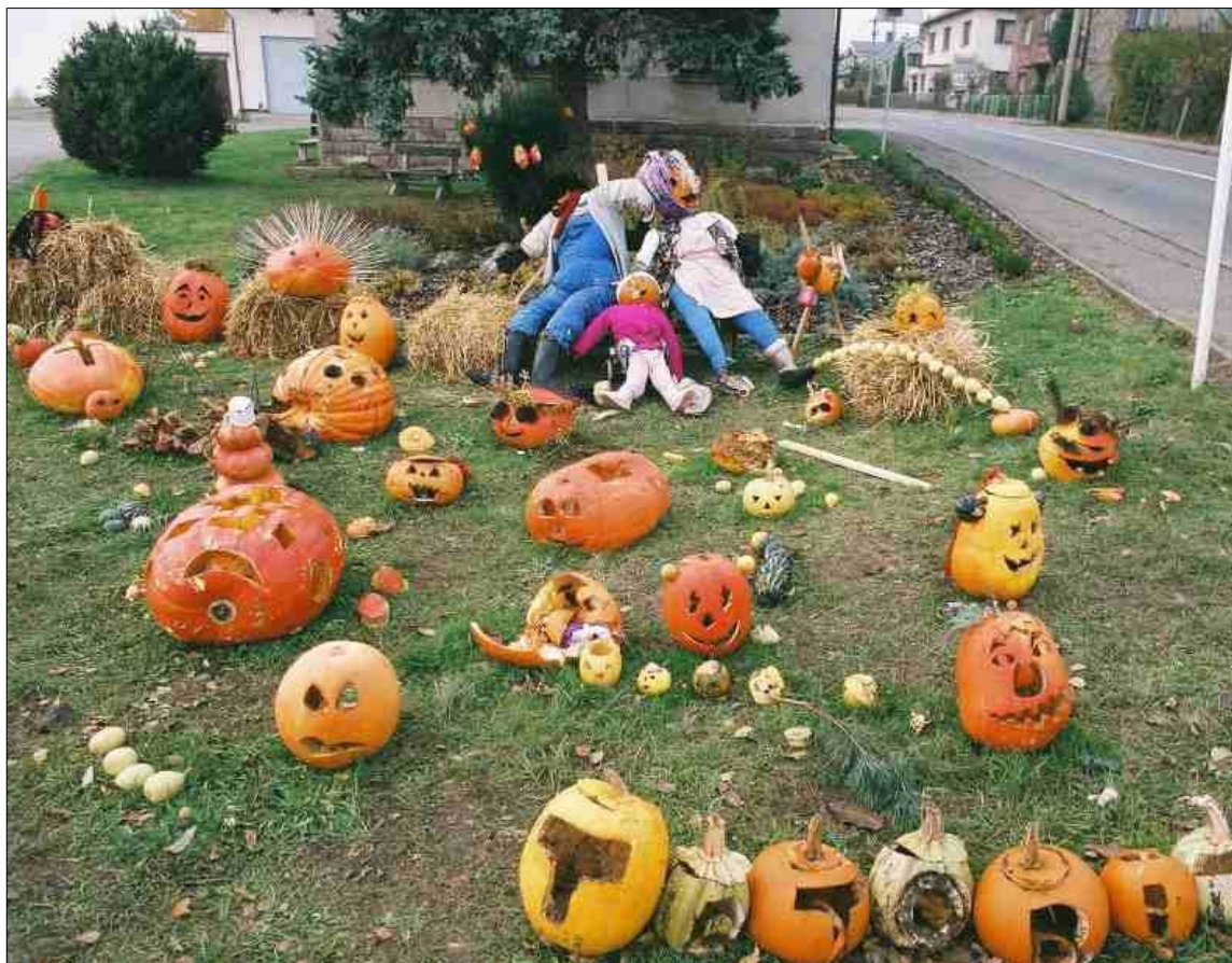
Starší snímek z Tatobit