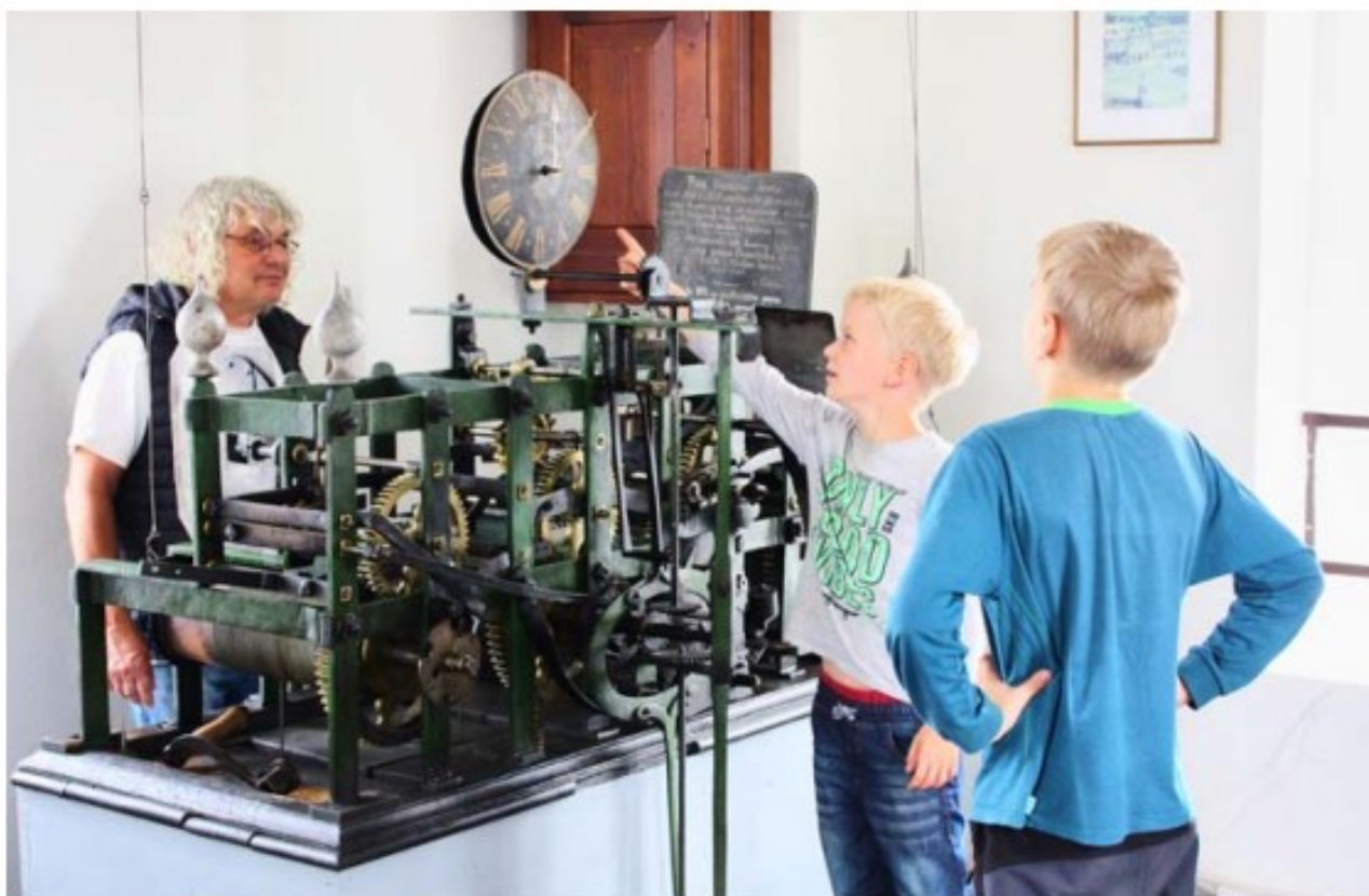
Jilemnické hodiny tak mají potvrzené, že jsou to hodiny s nejčtetnějším odbíjením v ČR.